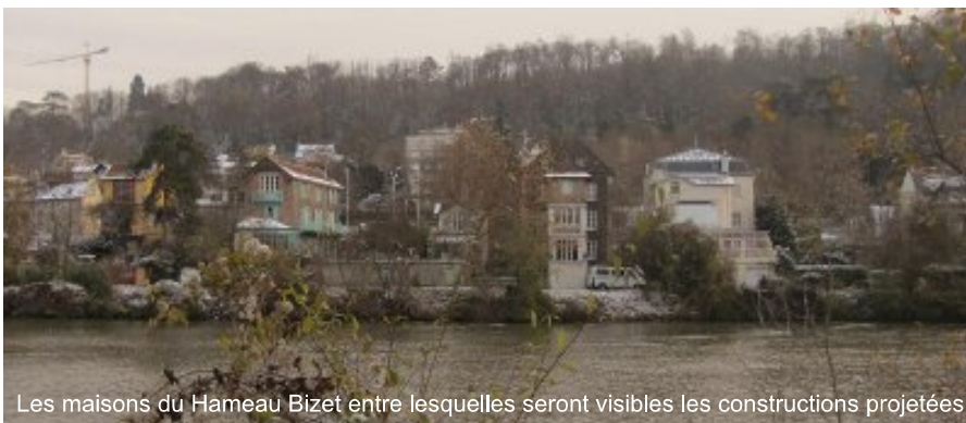
Les maisons du Hameau Bizet entre lesquelles seront visibles les constructions projetées

Heureusement, quand les oppositions se manifestent de manière massive on finit par être entendus. C'est ce qui vient de se passer à Rueil contre la tour Vinci.